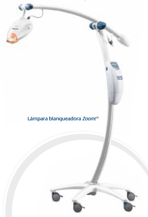
Lámpara blanqueadora Zoom!®

R: Durante el procedimiento en clínica, los pacientes pueden ver la televisión o escuchar música cómodamente. A las personas con un fuerte reflejo faríngeo o que padezcan ansiedad podría resultarles difícil someterse al procedimiento entero y deberían hablar con su dentista antes del procedimiento.